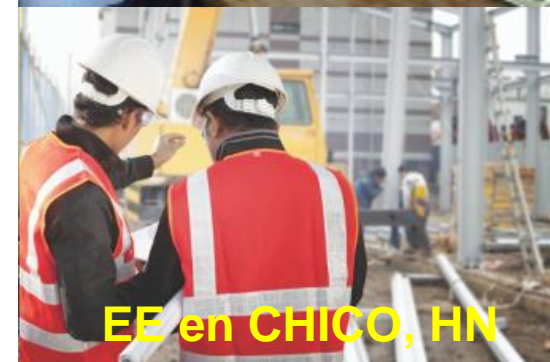
EE en CHICO, HN