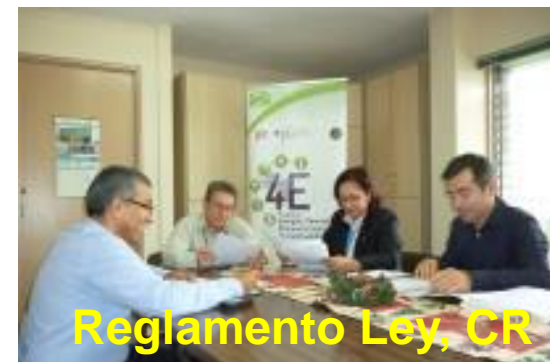
Reglamento Ley, CR