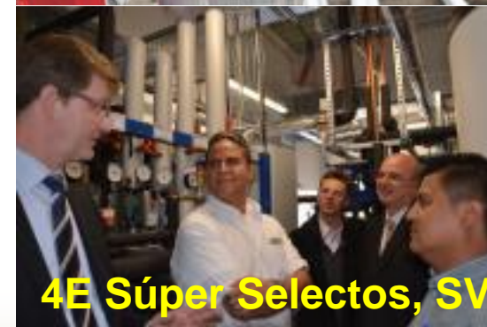
4E Súper Selectos, SV