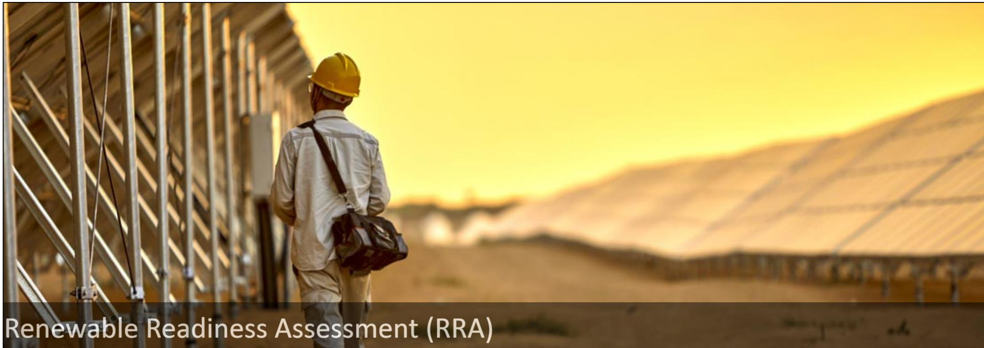
Renewable Readiness Assessment (RRA)